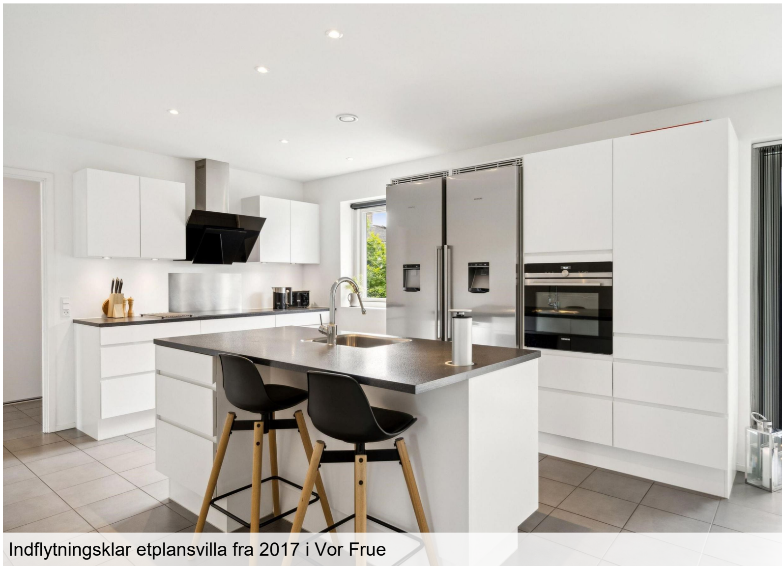
Indflytningsklar etplansvilla fra 2017 i Vor Frue